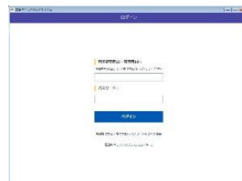
図2: 建レコアプリログイン画面