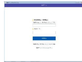
図 2: 建レコアプリログイン画面